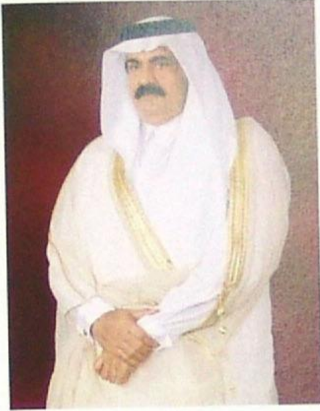
حضرة صاحب السمو الشيخ حمد بن خليفة آل ثاني أمير دولة قطر المفدى